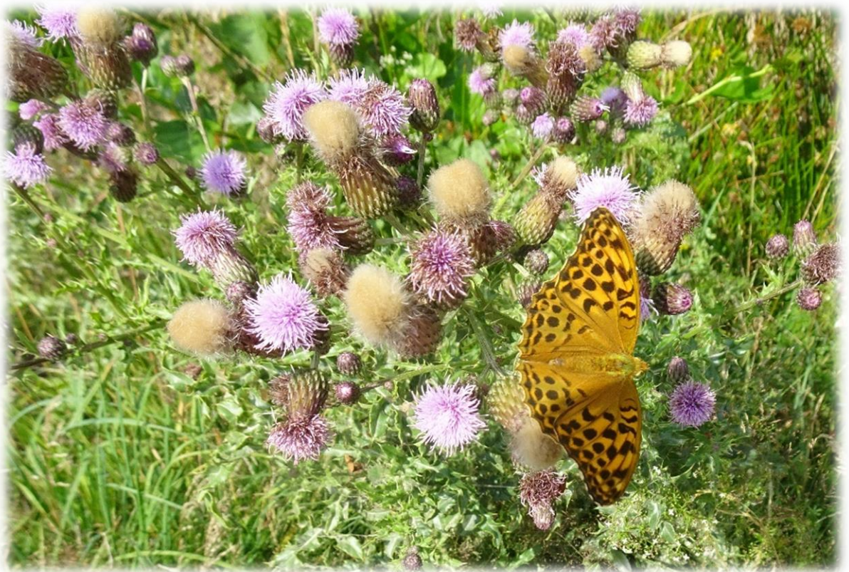
Keizersmantel is een van de allergrootste vlinders van de Ardennen. Deze forse knaap tref je aan langs bosranden en langs brede bospaden waar veel bermbloemen zijn. Hij vliegt aan