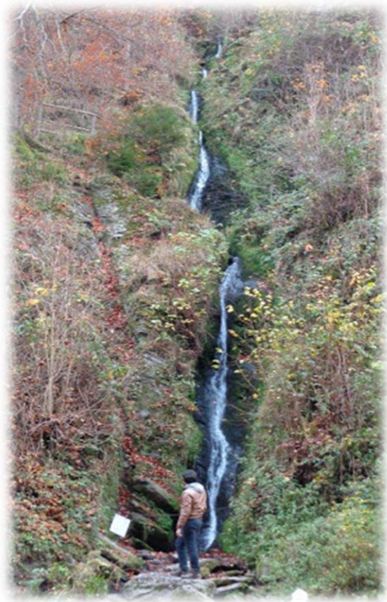
De waterval van Reinhardstein. Het water valt 60 m diep in de vallei van de Warche en is meteen de hoogste waterval van België.