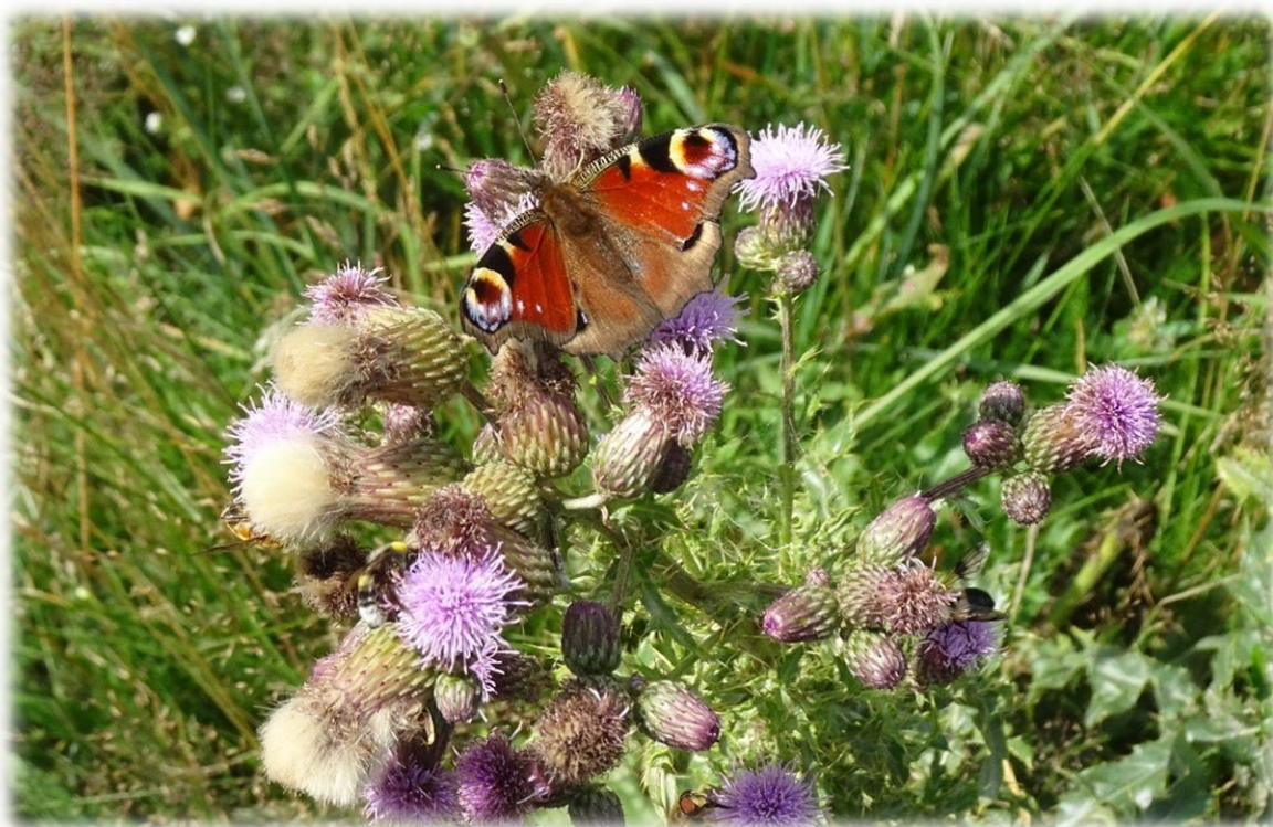
Dagpauwoog is een van de meest voorkomende vlinders. De 'ogen' hebben een afschrikfunctie voor vijanden. Hij overleeft bijna een jaar lang, 's winters in schuren en