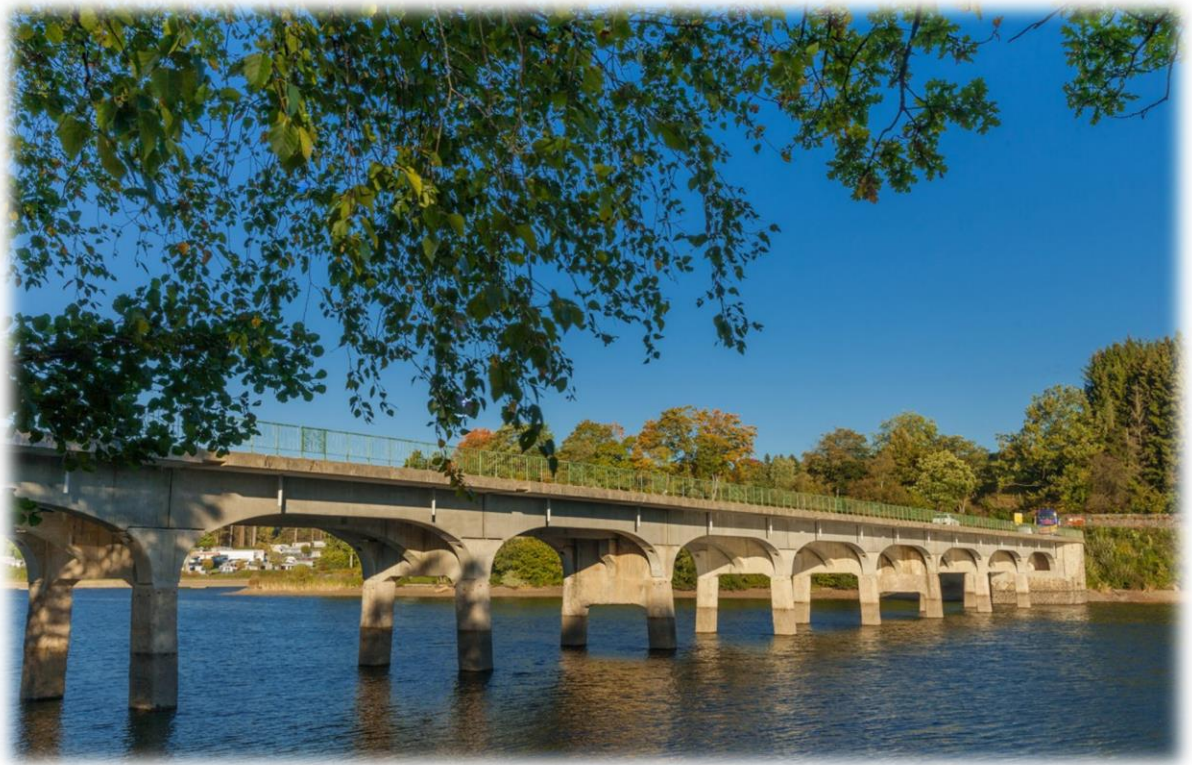
De brug van Haelen werd samen gebouwd met de stuwdam. De brug werd genoemd naar het dorp Haelen bij Diest waar het Belgische leger op 12/08/1914 een Duitse aanval had afgeslagen. In de zomer van 1944 hebben de Duitsers een deel van de brug opgeblazen om de