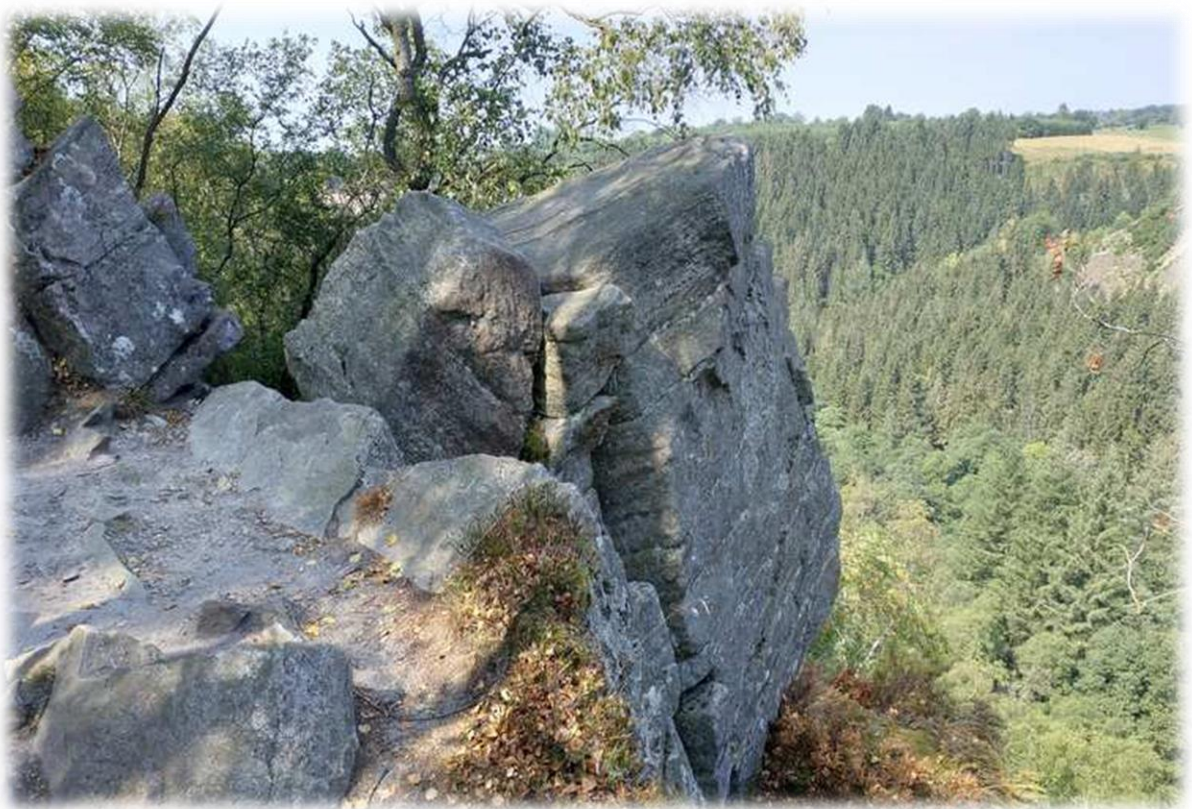
De Neus van Napoleon is een uitstekende rotspunt van waaruit men een adembenemend uitzicht heeft over de vallei van de Warche.