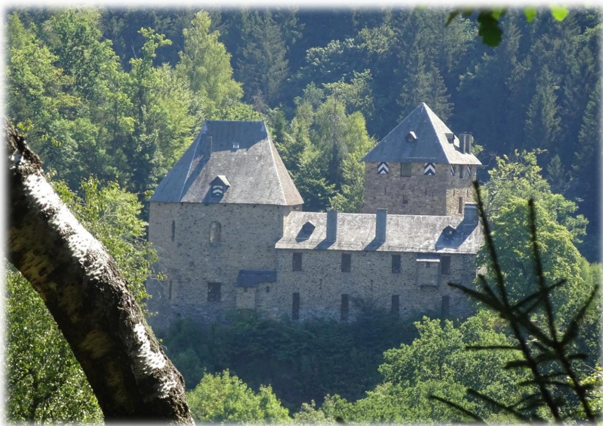
Tijdens de beklimming naar de Neus van Napoleon, krijgen we al een eerste zicht op het kasteel Reinhardstein.