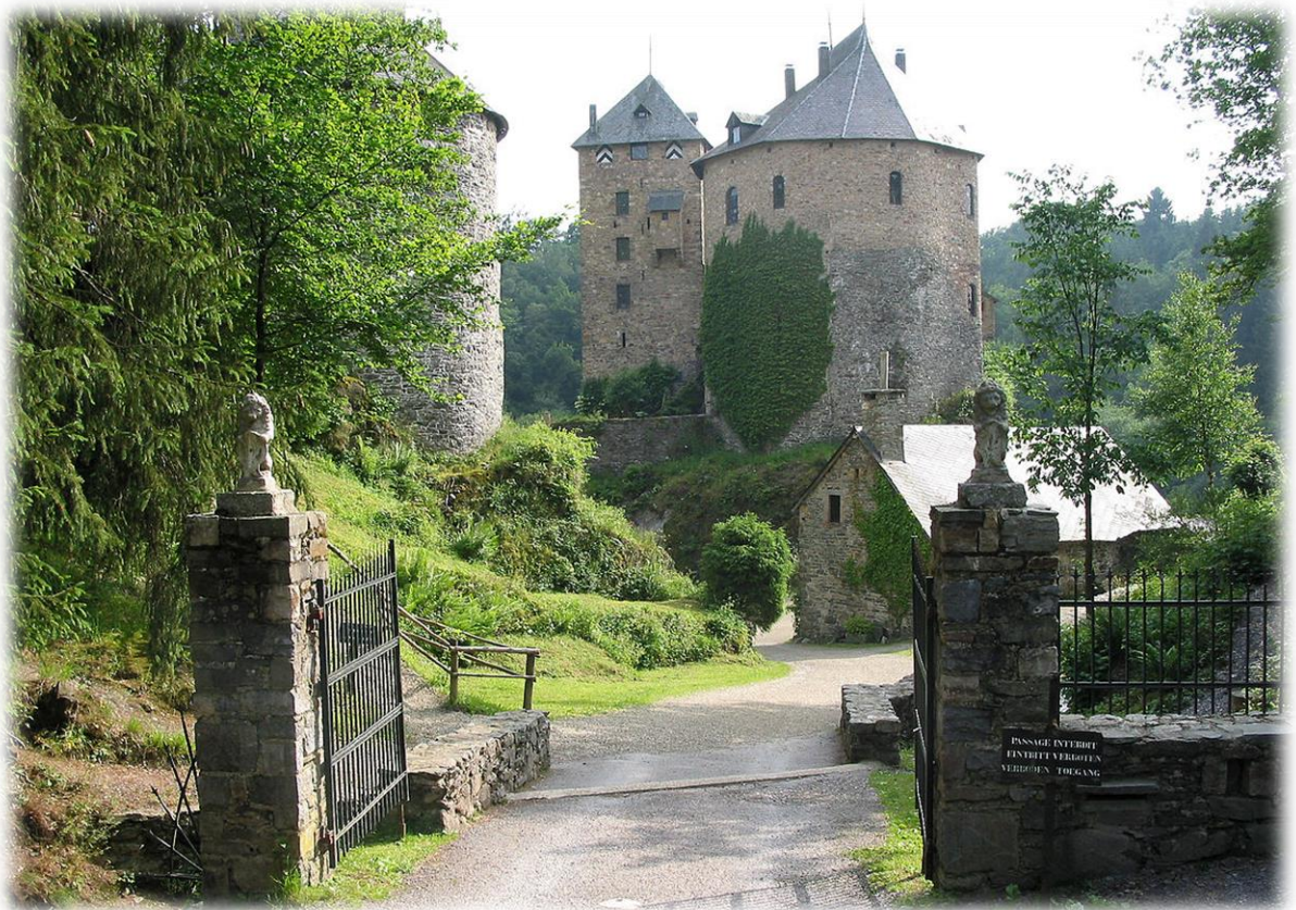
Kasteel Reinhardstein. Het kasteel, vandaag uniek in België, werd opgetrokken in 1354. Nadat het was vernield, werd het vanaf 1969 herbouwd in overeenstemming met