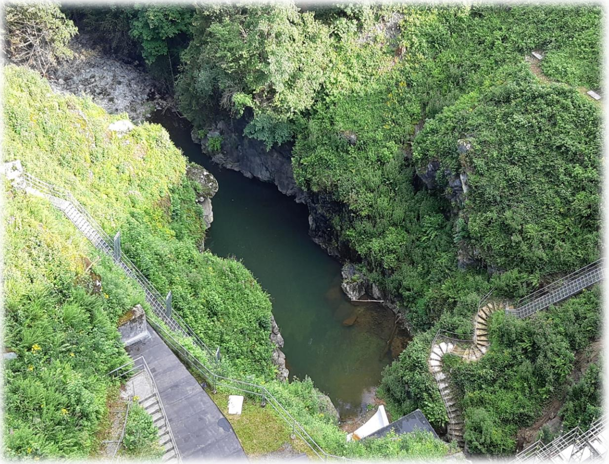
De Warche ontspringt op een hoogte van 650 meter boven de zeespiegel. De bron van deze rivier ligt in Losheimergraben aan de Belgisch-Duitse grens. De stroom loopt ongeveer 50